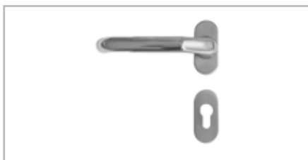
Innendrücker mit ovaler Rosette 18600-0053 Edelstahl