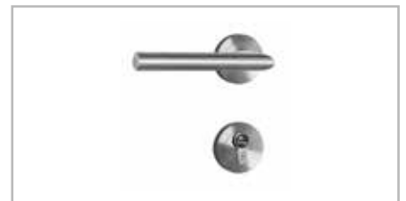
Innendrücker mit runder Rosette 18886 Edelstahl