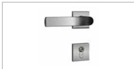
Innendrücker mit eckiger Rosette 18896-0053 Edelstahl