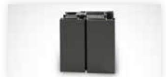
Arcade 79 mm