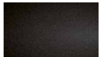
Design Nuten ähnlich Tiefschwarz