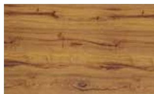
Stadelholz - GD026

Durch unser eigens entwickelten Produktionsablauf können wir dunkle Nuten herstellen. Diese Neuheit macht uns Einzigartig und ermöglicht uns neue Innovationen auf dem Haustürenmarkt.