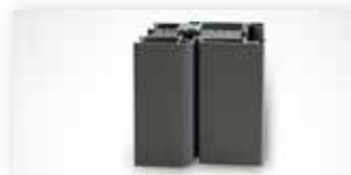
Symphonie 90 mm